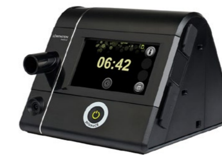
(PRISMA CR) ASV