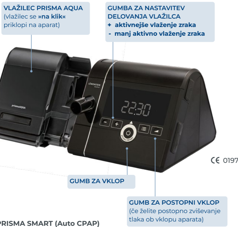
PRISMA SMART (Auto CPAP)

PRISMA SMART aparati se preko Bluetooth tehnologije povežejo z Prisma Smart aplikacijo, kjer lahko spremljate učinkovitost spalne terapije.