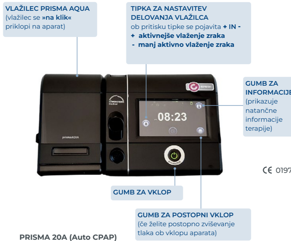
PRISMA 20A (Auto CPAP)

Pripomočki se lahko uporabljajo samo po navodilih zdravnika. Zagotavlja se pozitiven tlak v dihalnih poteh za lajšanje s spanjem povezanih motenj dihanja pri bolnikih, ki dihamo spontano. Pripomočki se uporabljajo v kliničnih ustanovah in domačem okolju.