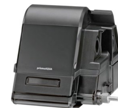
(VLAŽILEC PRISMA AQUA)

* vse prisma naprave vključujejo vlažilec